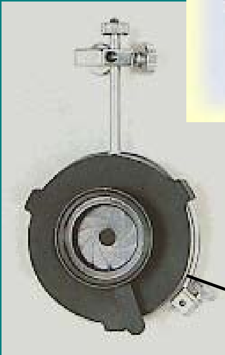
Irisblende für mehr Tiefenschärfe